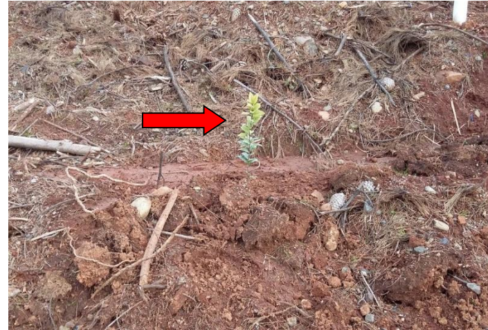
Figura 2. Una de las 500 plantas de especies nativas sembradas en la cuenca hidrográfica 1