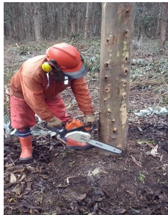
Figura 6. Curso de capacitación en seguridad y prevención de riesgos al usar maquinaria de extracción (realizado el 10 de agosto de 2015).