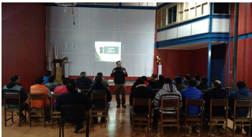
Figura 7. Curso de capacitación en prevención de riesgos laborales y seguridad en el trabajo para aquellos en puestos administrativos (realizado el 23 de julio de 2015)