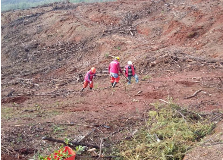
Figura 1. Día 2 de la restauración de la cuenca hidrográfica por parte de Bosques Cautín