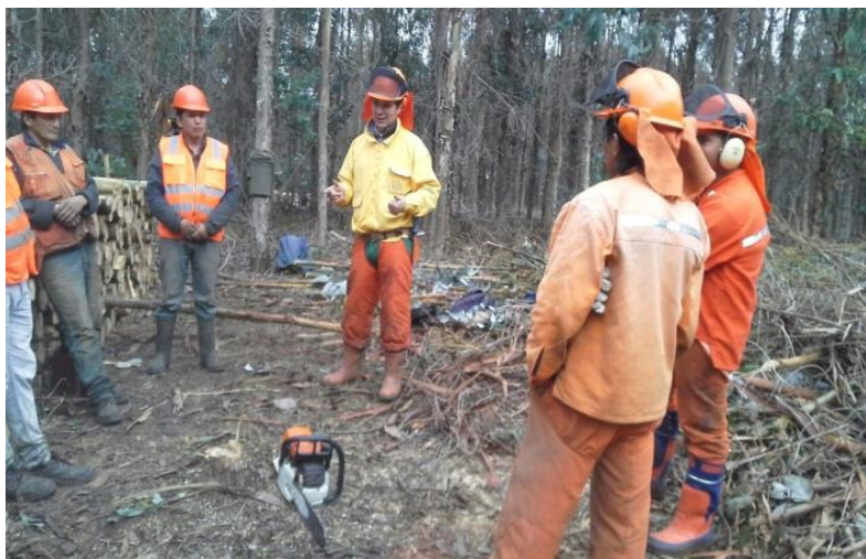
Figura 5. Curso de capacitación sobre seguridad y prevención de riesgos al usar maquinaria de extracción (realizado el 10 de agosto de 2015).