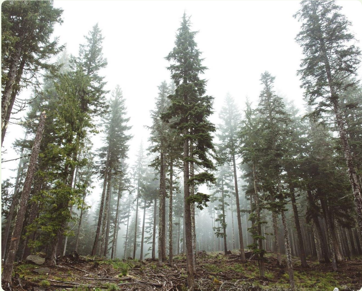
La economía del remedio