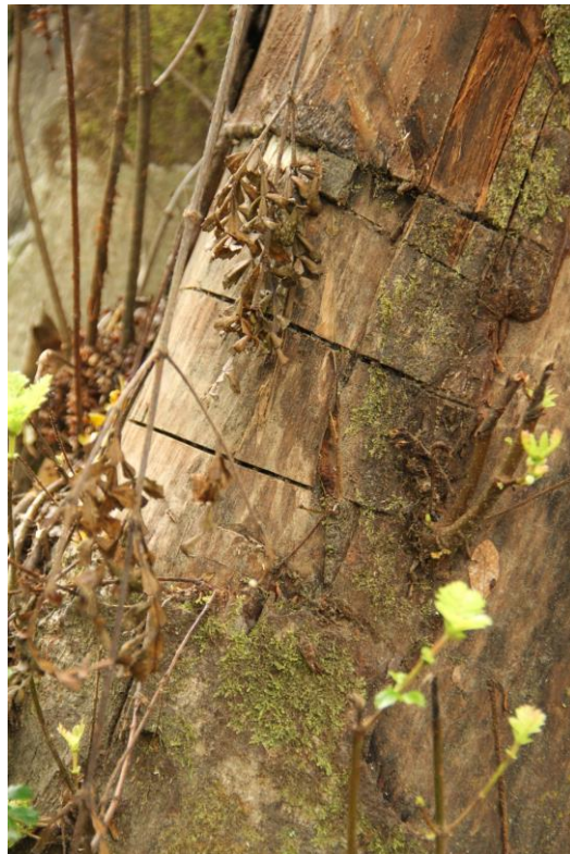
Figuras 1 y 2. Al tratar de recoger la corteza, el colector cortar demasiado profundo en el árbol, lo que significa que el árbol va a morir como consecuencia 1 .