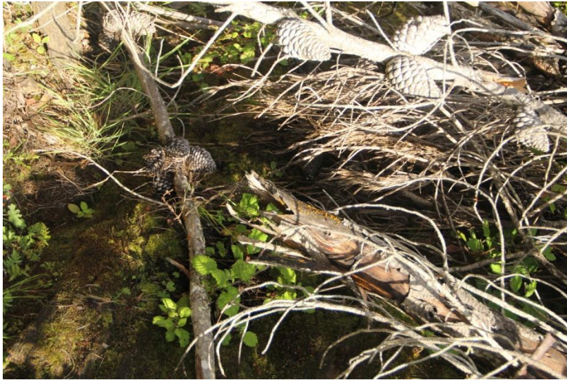
Figura 3. Anteriormente las ramas de pino de la plantación fueron arrojadas en el hábitat de plantas medicinales mientras ahora se mantienen dentro de la plantación de pinos para evitar perturbar el hábitat de las plantas medicinales y evitar que las vacas accedan al habitat (ver foto abajo).