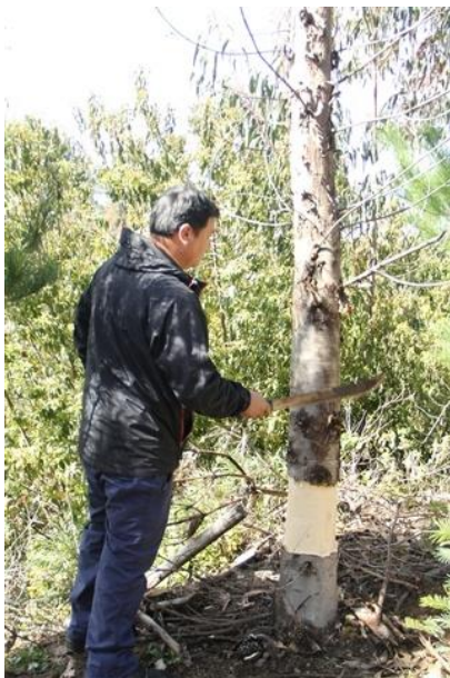
Figura 7. Matar un árbol no deseado en el área de la planta medicinal.