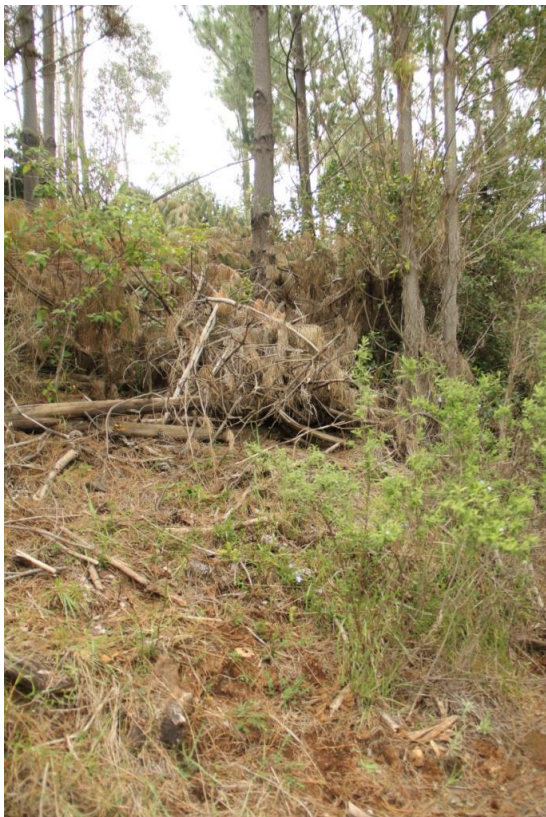
Figura 4. Una cerca natural de ramas de pino para evitar el acceso del ganado al hábitat de plantas medicinales.