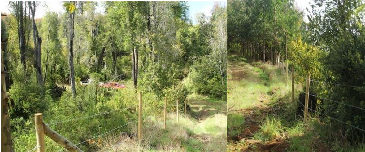
Figuras 5 y 6. Valla para evitar el acceso del ganado.